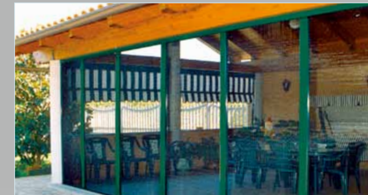
Einbaubeispiel für 6 verkettete Elemente an einem Wintergarten.

Das Plissé-System eignet sich für alle Türöffnungen wie Wintergärten, Balkon- und Terrassentüren. Die ideale Lösung auch für Hebe-Schiebetüren.